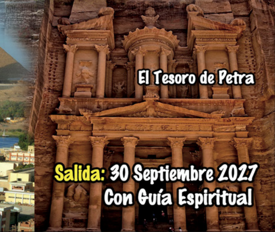
El Tesoro de Petra